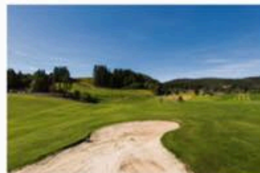
Golfbanen / 10 dekar store banen med 9 hull.