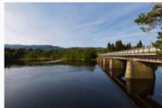
Nidelva / Test fiskeulykken i vassdraget.

– For det første får dere et sunt hjem, med lavt energiforbruk og minimalt med vedlikehold. Du får også mer for pengene om du er villig til å bevege deg litt utenfor Trondheim. Ønsker du å komme deg inn på markedet, er dette et perfekt sted å starte.